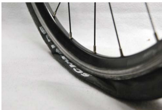
Platten leicht reparieren.

Alle Mitglieder und weitere Fahrrad-Interessierte sind herzlich willkommen.