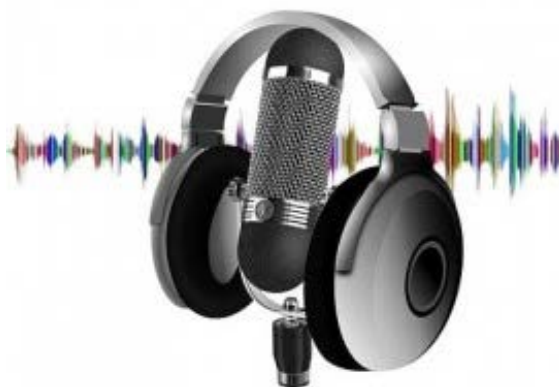
hör doch mal rein..

Alle Infos zu unseren aktuellen Codiermöglichkeiten findet Ihr hier .