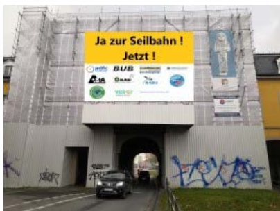
Seilbahn Koblenzer Tor