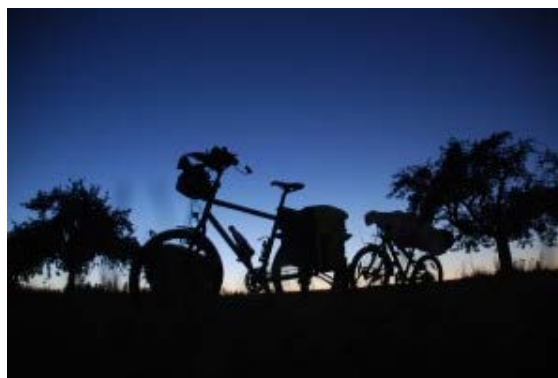
Kocher-Jagst Familientour