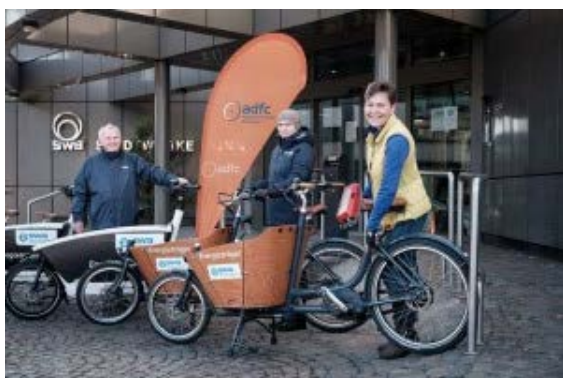
Auch die neuen Leih-Lastenräder der SWB sind vom ADFC codiert