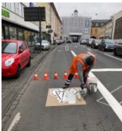
Piktogramm am Belderberg